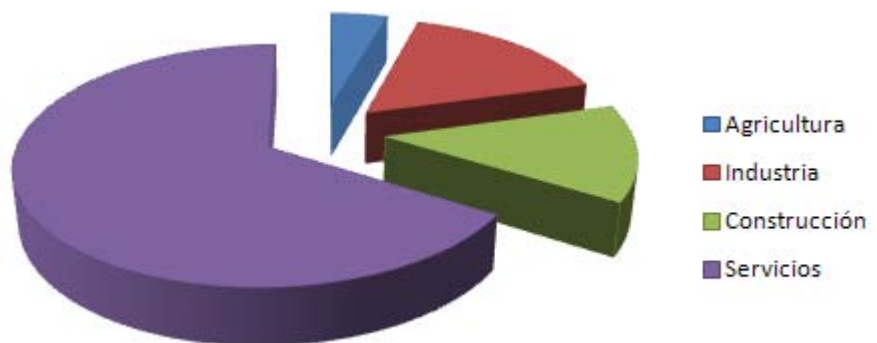
Diferencias en el aparo por sectores. 3er. trim. 2010

ver cómo se ha invertido la tendencia en la que la industria era el segundo sector con mayor número de desempleados (233.700) mientras que el sector de la construcción se contabilizaban 196.300 desempleados, esto debido al boom inmobiliario que se produjo, que ha dejado tras de sí al estallar la burbuja, una gran cantidad de mano de obra en el desempleo. De los cuales, muchos de ellos, fueron jóvenes que abandonaron